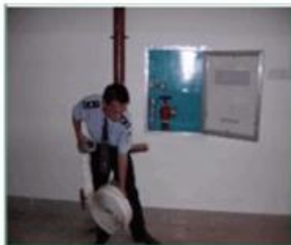
(2) 取出消防水带向火点展开