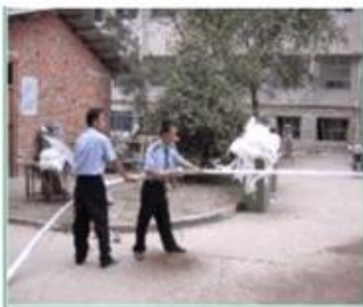
(5) 手握水枪头和水带，打开水阀门，对准火源的根部喷射