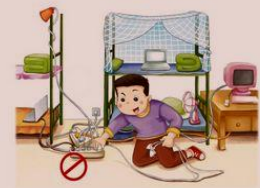
正确使用电器设备，不乱接电线

十、正确使用电器设备，不乱接电源线，不超负荷用电，及时更换老化电器设备和线路，外出时要关闭电源开关。