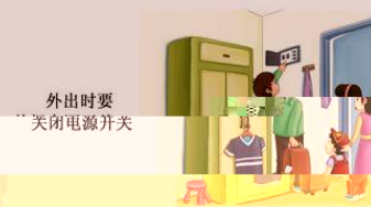
外出时要关闭电源开关

十一、正确使用、经常检查燃气设施和用具，发现燃气泄漏，迅速关阀门、开门窗，切勿触动电器开关和使用明火。