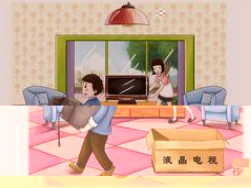
及时更换老化电器设施和线路